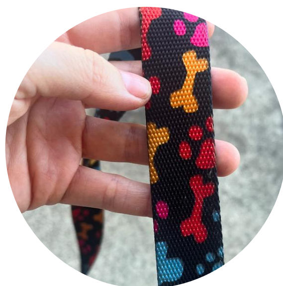
NEGRO CON HUELLAS Y HUESOS DE COLORES